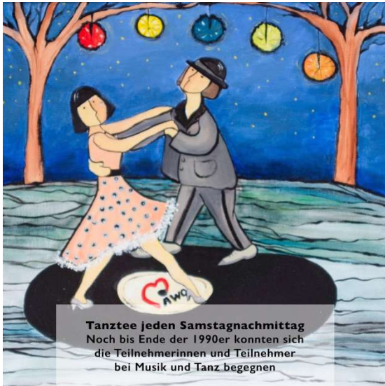
Tanztee jeden Samstagnachmittag Noch bis Ende der 1990er konnten sich die Teilnehmerinnen und Teilnehmer bei Musik und Tanz begegnen

In den Begegnungsstätten der Arbeiterwohlfahrt setzen sich ältere Menschen zwanglos und ohne Verpflichtung nachmittags zusammen, um bei Spiel, Kaffee und Kuchen oder bei Vorträgen der heimischen Einsamkeit zu entrinnen.